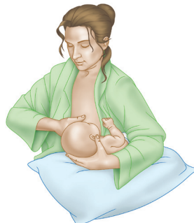
Debajo del brazo