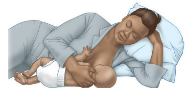
Acostada de lado

(*se usa con frecuencia después de las primeras semanas)