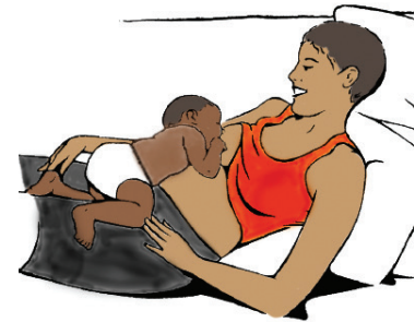
Ngả lưng ra sau

Để bụng bé áp sát vào bụng mẹ là điều tự nhiên nhất cần làm ngay sau khi sinh. Khi bé có dấu hiệu tìm kiếm bầu ngực, hãy hướng dẫn bé. Bé sẽ rúc vào và ngậm lấy bầu ngực. Cho con bú trong tư thế ngả lưng thoải mái phù hợp với bản năng tự nhiên của bé.