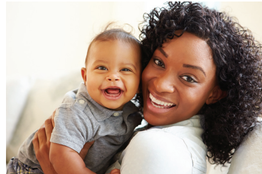
ကယ်ရိုလိုင်းနား ကမ္ဘာလုံးဆိုင်ရာ မိခင်နို့ချိုတိုက်ကျွေးမှုအဖွဲ့အစည်း 15