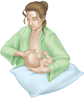
ဘောလုံးကိုင်