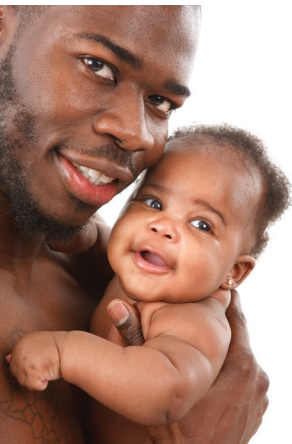
လက်တွဲဖော်များနှင့်လည်း အရေပြားချင်းထိတွေ့မှုရှိစေခြင်းက အထူးကောင်းမွန်သည်

မွေးကင်းစကလေးများ၏ အရေပြားပေါ်ရှိ ရှိ ခရင်မ်များသည် ရင်သွေးများအတွက် ကောင်းမွန်ပါသည် - ခရင်မ်သည် သူတို့၏ အရေပြားကို ပိုးဝင်ခြင်းမှကာကွယ်ပေးပြီး နွေးထွေးနေစေပါသည်။