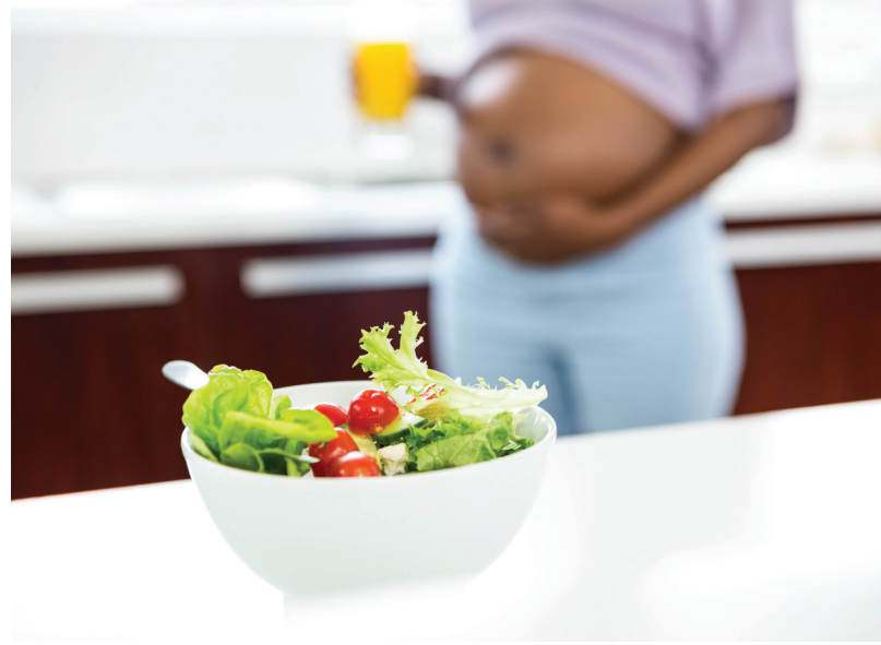
ကယ်ရိုလိုင်းနား ကမ္ဘာလုံးဆိုင်ရာ မိခင်နို့ချိုတိုက်ကျွေးမှုအဖွဲ့အစည်း 3