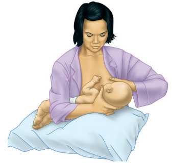
حمل الطفل على الذراع بالعكس