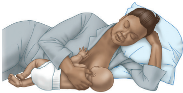
الإنكباء إلى الجنب