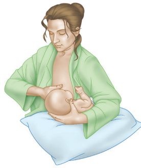
حملة مثل كرة القدم الامريكي