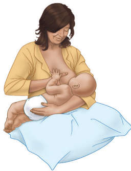
حمل الطفل على الذراع