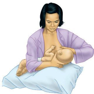
Поза «перехресна колиска»