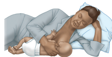
Лежа на боку